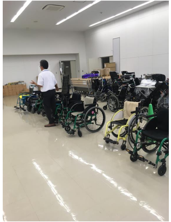
写真 2 (株)松本義肢製作所